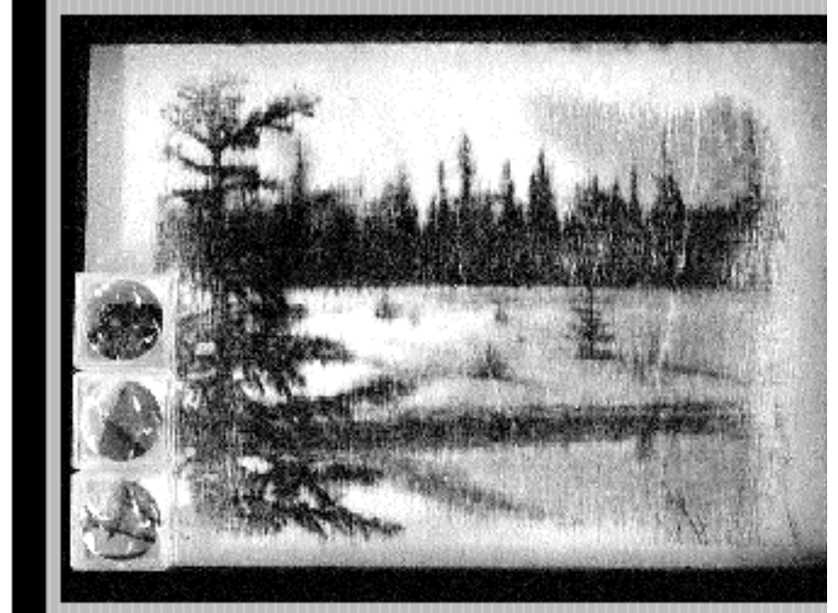
Finland - Photo Transfers-kuvien taustalla on Äkäslonkion maisemia Suomen Lapista vuodelta 2001.